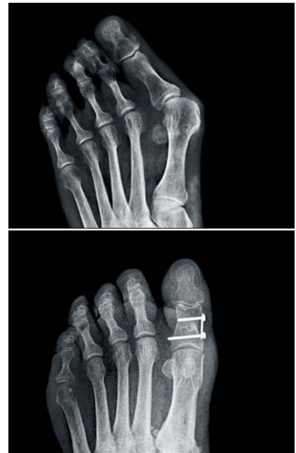
Metatarsalgien können oft auf einen Hallux valgus (hier vor und nach der Operation) zurückgeführt werden.