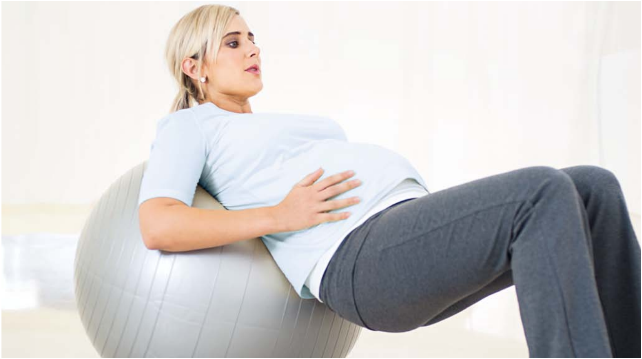
Positive emotionale Empfindungen während der Geburt können den Schmerz lindern und zur Entspannung beitragen.

Das Salem-Spital ist schweizweit das erste Spital, das Remifentanyl in der Geburtshilfe angewendet hat. Es verfügt dadurch über die höchsten Erfahrungswerte. Mittlerweile wird die Methode auch an 16 anderen Schweizer Spitälern angeboten.