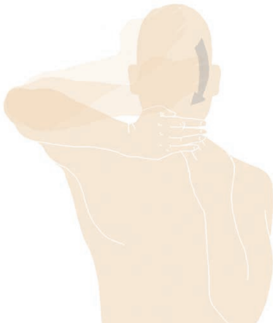
Abb. 2 Das sogenannte «horn blower sign»: Der Patient kann den Arm in der Horizontalen nicht stabilisieren und hat Mühe, Verrichtungen am Gesicht durchzuführen.